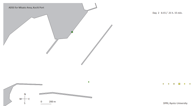
図-3 試算結果のスナップショット ( t=76,500 s)

このように、設定条件の精査が今後必要であるものの、タンカー、貨物船及びフェリーという複数の種類の船舶が船舶輸送を行うようにモデルを改良した。なお、今回の設定条件では、午前6時の段階で入港待ちしていた船舶は、同日の午前10時10～20分の間に解消した。