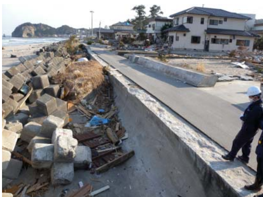
図-20 倒れた護岸パラペット部