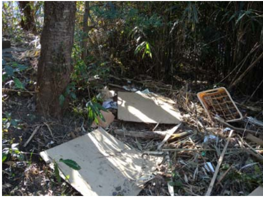
図-9 神社参道脇の漂流物