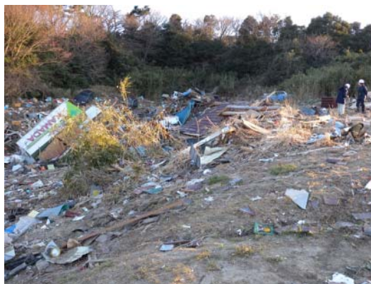
図-4 原釜尾浜海水浴場奥の津波遡上限界