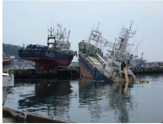
図-17 漁港区に打ち上がった漁船