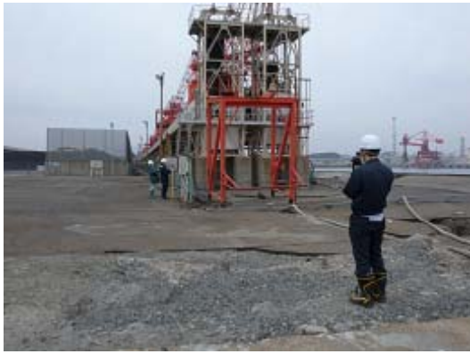
図-16 7号埠頭先端の機械類