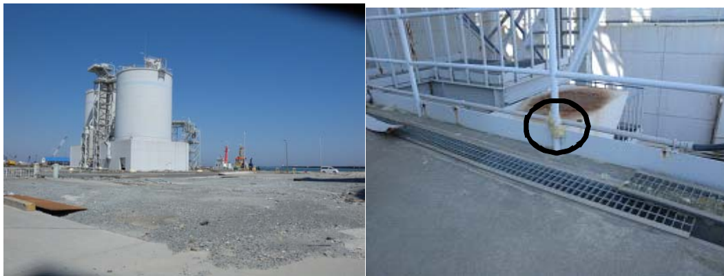
図-2 第1埠頭におけるサイロ（左）と津波痕跡（右）