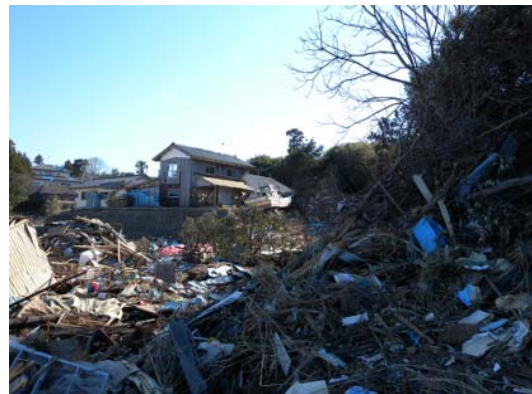
図-12 遡上限界地点周囲に打ち上がった漁船