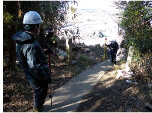
図-10 遡上限界地点から見た街の被災状況