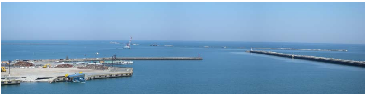
図-8 沖防波堤の被災状況