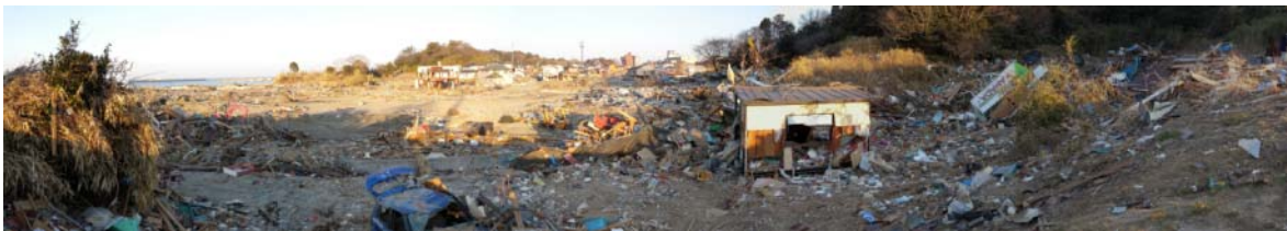
図-7 原釜尾浜海水浴場奥の遡上限界から海側の被災状況