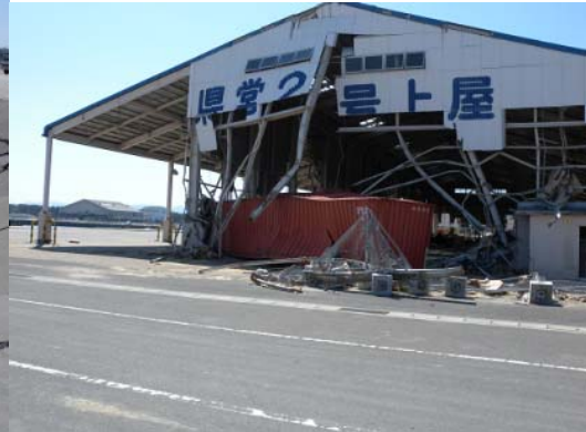
図-6 上屋に衝突したコンテナ