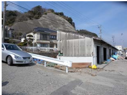
図-18 中之作漁港における被害の少なかった地域