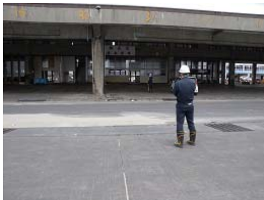
図-14 漁港区魚市場の建物

沖防波堤、西防波堤（第一）および西防波堤(第二)には、津波による被災はほとんど見られなかった。なお、1号埠頭先端の両角部の海底において、津波による5m程度の局所的な洗掘が生じていた。また、港内の泊地においても、場所によっては最大で8m程度の洗掘が見られた。