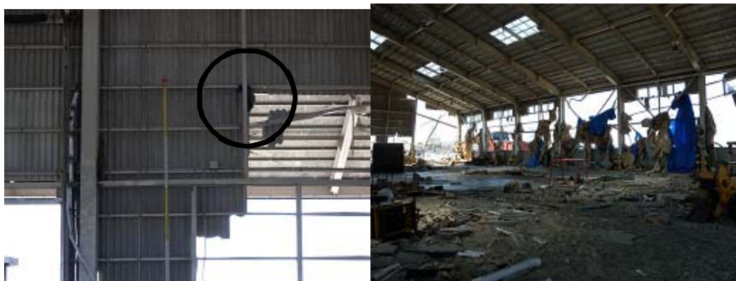
図-3 第2埠頭における津波痕跡（左）および壁の破損状況（右）