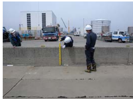
図-15 4号埠頭の高さ0.84mの胸壁、ポンプ場およびタンク