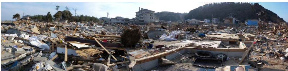
図-20 兎渡路における家屋等の流失

津波痕跡高を測量した木造家屋の隣は完全に流失していた。さらに、この木造家屋や独立行政法人国立病院機構いわき病院から北へ200m程度離れた平地部では、図-20に示すように居住地域が壊滅していた。さらに、流失被害を受けた建物があったと思われる所では、図-21に示すように護岸のパラペット部が被災していることが多く、前面海域の水深変化に伴う局所的な津波の集中があった可能性がある。