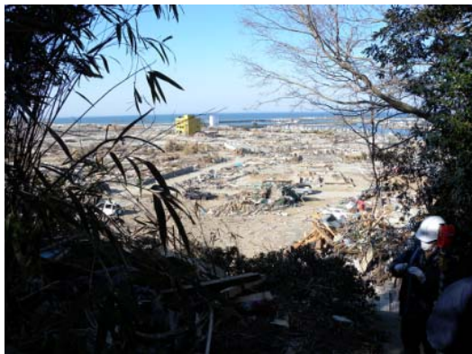
図-11 遡上限界地点から見た街の被災状況

図-11 は遡上限界地点から見た漁港背後の街の被災状況である。黄色の鉄筋コンクリート造の3階建ての家屋が残っており、この屋上では窓ガラスが割れ、砂も残っていたことから津波の打ち上げ高はこの建物を越えたと思われる。また、遡上限界周辺の高台には、図-12 に示すように漁船が数隻打ち上がっていた。