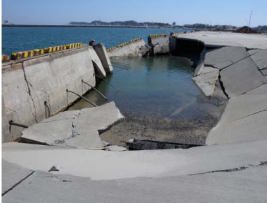
図-5 第1埠頭における物揚場の沈下

ある北防波堤および南防波堤にはほとんど被災は認められなかった。これは、沖防波堤による津波低減効果があったためと現段階では推察される。また、沖防波堤背後の航路や泊地などにおいて、津波による大規模な洗掘が生じていた。