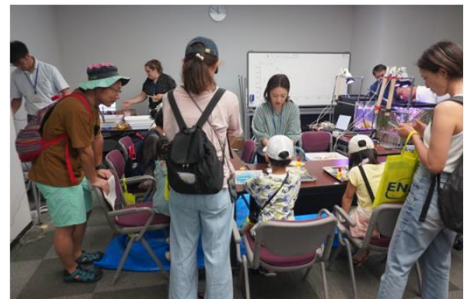
フォトフレームをキレイな貝殻で飾り付けよう

参加お申込み、詳細情報は下記特設webサイトをご覧ください。 ( https://www.research-portandairport.com )