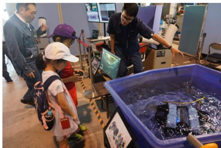
はたらく水中ロボット