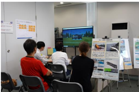
ドローンシミュレーター