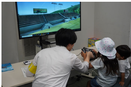
ドローンシミュレータ