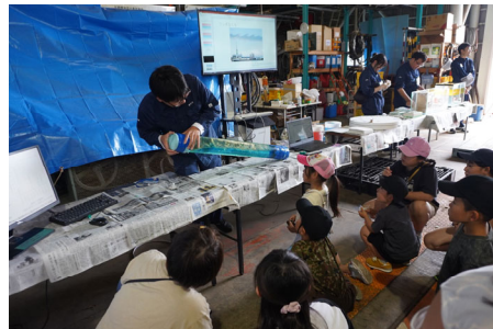
海の流れの不思議