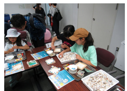
フォトフレームをキレイな貝殻で飾り付けよう

参加お申込み、詳細情報は下記特設webサイトをご覧ください。 ( https://www.pari.go.jp/event/open/2026/index.html )